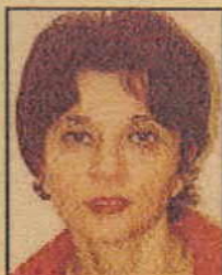
* VILLAROSA Dr.ssa Maria Nunzia, Archivio di Stato di Catania