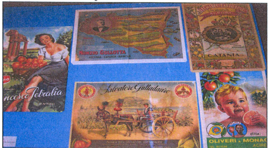
1940-1950: Carte veline (usate per avvolgere gli agrumi da vendere o da esportare).