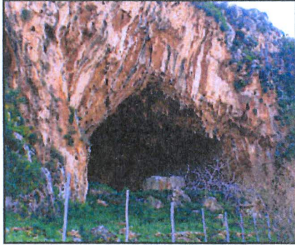
Bagheria - Grotta Mazzamuto

Mostra fotografica illustrativa della Sicilia nei suoi paesaggi agresti a cura di Angelo Restivo. Nella giornata inaugurale sarà possibile degustare prodotti tipici mediterranei