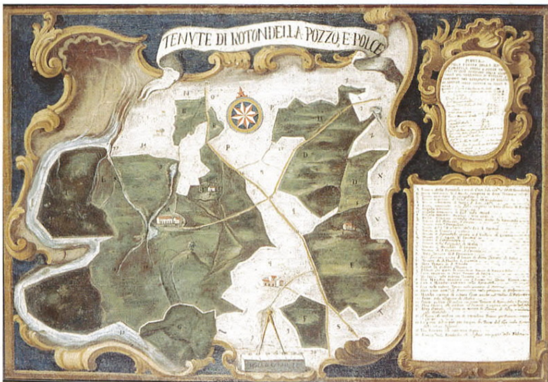
Fig. 210 Olio su tela (1824) raffigurante le terre dei padri benedettini nel territorio di Troina (nella pagina seguente)

di Santa Maria di Licodia di Catania, nelle quali erano contenute.