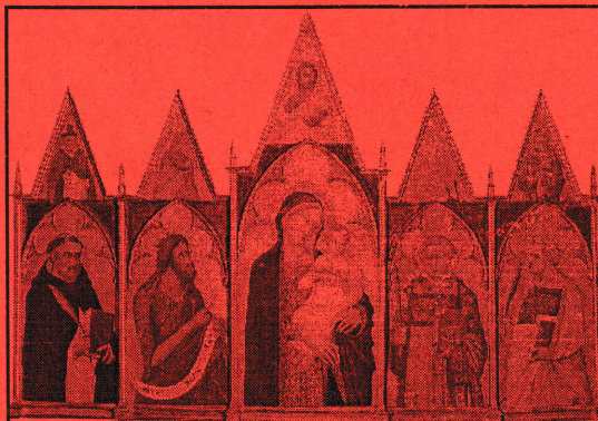
CAPOLAVORI RITROVATI A SIENA