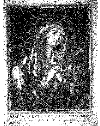
Maria SS. Addolorata Incisione di N. Filippone