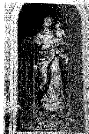
Statua della Madonna del Carmine Chiesa Madre Comiso

Da queste iniziative sono emerse certezze, ma anche interrogativi che aprono nuove prospettive di ricerca, le cui soluzioni potranno trovarsi, ancora una volta, nei documenti.